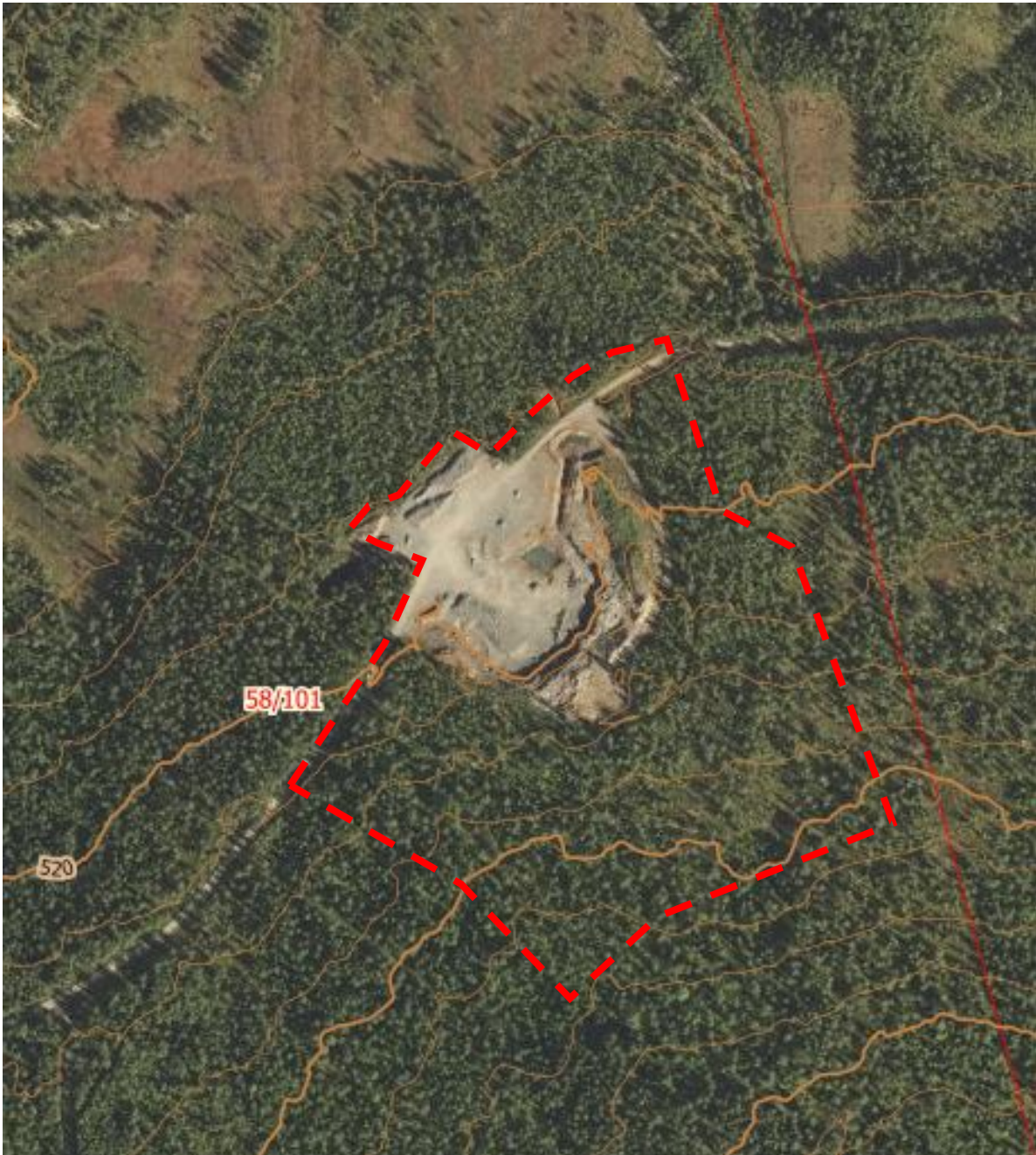
Illustrasjon eksisterende steinbrudd og foreslått utvidelse.

Jf. referat fra oppstartsmøte skal det utarbeides planprogram og konsekvensutredning (jf. forskrift om KU, vedlegg II, §8) som del av videre planarbeid. Dette gjelder bl.a. forurensning/ støy, landskap, landbruk, naturmangfold og befolkningens helse.