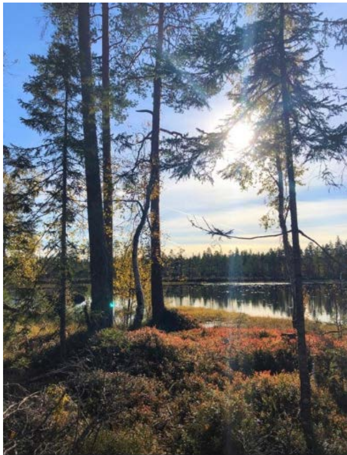
Foto: Kverntjernet sett fra nordsiden mot sørvest.