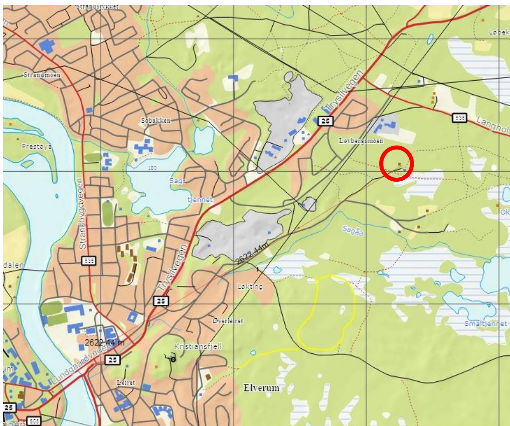
Oversiktskart med angivelse av planområde (rød sirkel).

Planen fremmes som en privat reguleringsplan hvor Arkitektbua AS er engasjert til å utarbeide planen.